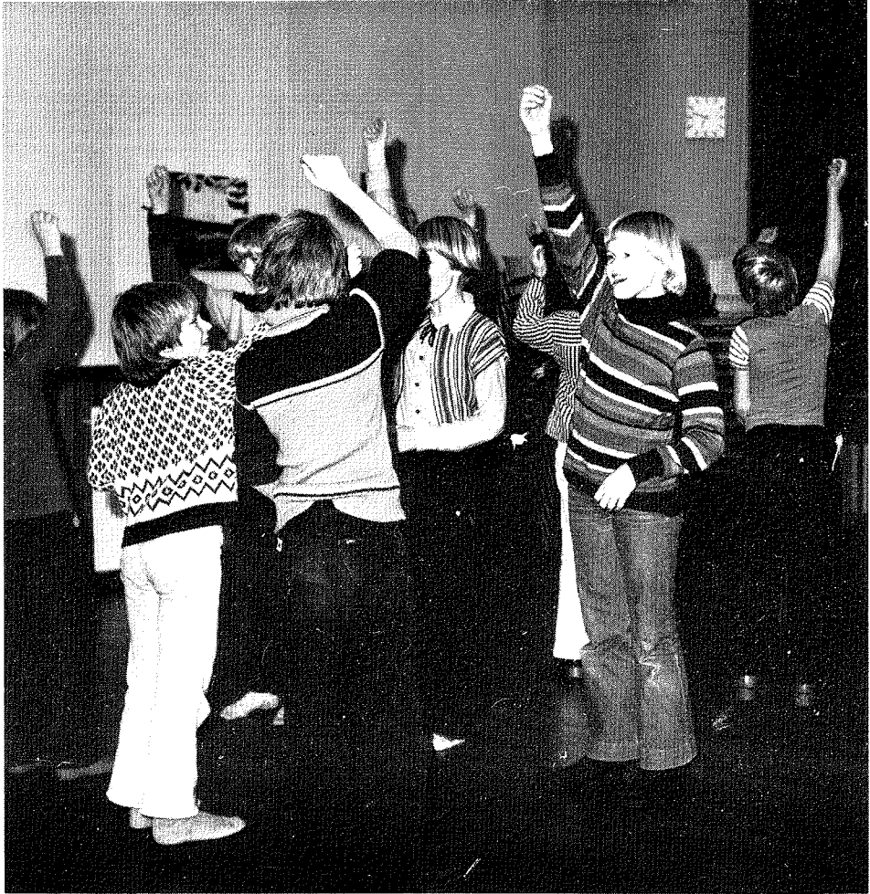
Een van de jeugdgroepen in West-Terschelling oefent het Schoenlappertje.