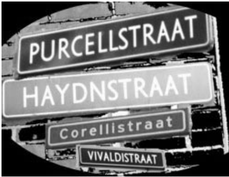
Een tentoonstelling van klassiekers

wijd aan belangrijke vrouwen: beroemde Leidse vrouwen, stichtsters van Leidse hofjes, (kinderboeken)schrijfsters, verzetstrijdsters, feministen etc.), ook wordt met straatnamen naar voorwerpen en andere meer alledaagse dingen verwezen, zoals in Amersfoort ( Het Vooronder, Het Kompas, Het Ruim, De Kajuit, De Boeg, Reling, Bakboord, Stuurboord ) en Alkmaar ( Gaffelstraat, Disselstraat, Passerstraat, Harpoenstraat, Schoffelstraat, Waterpasstraat, Houweelstraat, Vijzelstraat ). Sommige na-