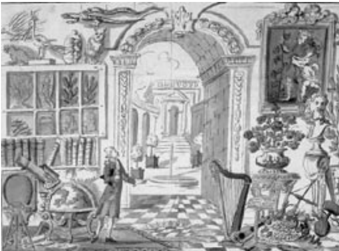
Orde der Gemengde Vrijmetselarij

Zowel de Rozenkruisers, de aanhangers van Swedenborg, de spiritisten als de theosofen geloven in de nauwe verbondenheid tussen de onzichtbare goddelijke wereld (het transcendente) en deze aardse wereld. Ze geloven in de immanentie van het goddelijke, wat betekent dat men als mens direct