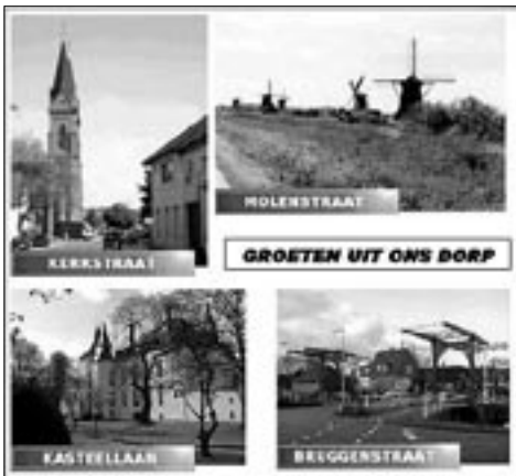
Het relatiemotief is in deze straatnamen duidelijk aanwezig

bij het geven van namen aan de straten in deze nieuwe woonwijken. Dit brengt ons terug bij de regels van de VNG, waarin duidelijkheid en systematiek de boventoon voeren: in een wijk met bomen- en struikennamen ( Magnoliastraat, Acaciastraat, Larixstraat, Elzenhof, Lindenstraat ) is niet sprake van één van de drie genoemde motieven, maar zijn de namen eerder gekozen met het oog op de vindbaarheid.