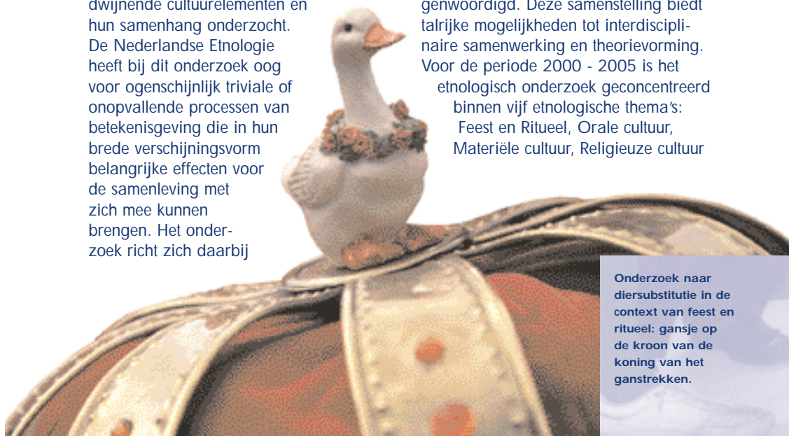
Onderzoek naar diersubstitutie in de context van feest en ritueel: gansje op de kroon van de koning van het ganstrekken.

Het Meertens Instituut te Amsterdam is de nationale instelling waar op het terrein van de Nederlandse etnologie op structurele basis wetenschappelijk en interdisciplinair onderzoek wordt verricht, wordt gedocumenteerd en archiveren en collecties worden verzameld. Kenmerkend voor de huidige samenstelling van de onderzoeksgroep Etnologie aan het Meertens Instituut is de multidisciplinaire samenstelling. In de onderzoeksgroep zijn disciplines als neerlandistiek, geschiedwetenschap, kunstgeschiedenis, muzikwetenschap, antropologie, sociologie en sociale geografie vertegenwoordigd. Deze samenstelling biedt talrijke mogelijkheden tot interdisciplinaire samenwerking en theorievorming. Voor de periode 2000 - 2005 is het etnologisch onderzoek geconcentreerd binnen vijf etnologische thema's: Feest en Ritueel, Orale cultuur, Materiële cultuur, Religieuze cultuur