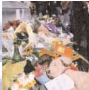
Collectief en publiek rouwbeklag na de moord op een Nederlandse politicus. Onderzoek naar de spontane herdenkingsplaatsen als 'performance of the self'.

Binnen het Meertens Instituut is ook het secretariaat van de SIEF, the International Society for Ethnology and Folklore ( www.siefhome.org ), ondergebracht.