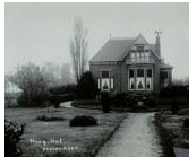
Het Hooghof rond 1930

Waling Dykstra stelt in Uit Friesland's volksleven (deel 2, 1896) dat waarzeggen een duivelskunst is, en vooral het werk van vrouwen is. Handkijksters kwamen toen niet meer voor in Friesland, wel kaartlegsters en kopjekijksters. In een aantal verhalen spreken de kaartlegsters en kopjekijksters een formule uit. Het meisje uit het verhaal had ook in een zwarte spiegel kunnen kijken om te weten te komen met wie ze zou trouwen. Vroeger stonden op kermissen tenten met zwarte spiegels die bezoekers in de toekomst lieten zien.