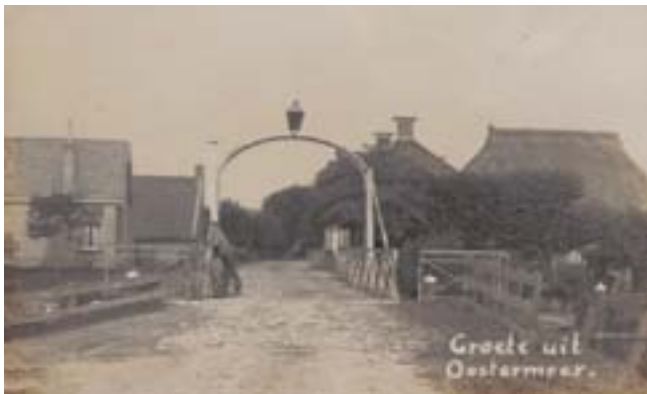
De brug rond 1916

De sage waarin gejammer in het water is te horen of een stem uit het water zegt dat de tijd is verschenen, maar de man nog niet, is een sage over spokerij. Deze populaire sage lijkt uit te dragen dat aan het noodlot niet valt te ontkomen.