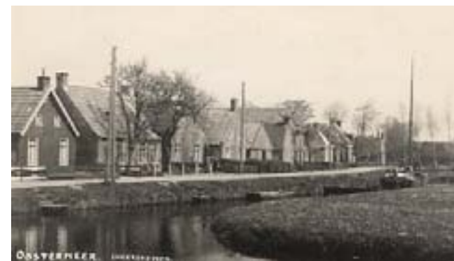
Snakkerburen rond 1943

De duivel heeft allerlei taboemen, zodat men zijn echte naam (Satan) niet hoeft te noemen: Janmaat, Hans Pik, Joost, enz. Mensen die een pact met de duivel sluiten, verkopen hun ziel. Tijdens hun leven worden ze dan door de duivel bijgestaan, maar na hun dood moeten ze eeuwig branden in de hel. In de volkse verhalen over doctor Faust laat de duivel zich zelfs vernederen tot allerlei karweitjes, maar zodra de tijd van de mens erop zit, neemt de duivel wraak. Faust werd bijvoorbeeld hardhandig door een traliehek getrokken door de duivel. Hier wordt het slachtoffer de nek omgedraaid. In Oostermeer is een veldnaam Jan Koartslân, afgeleid van de taboenaam Jan Kort.