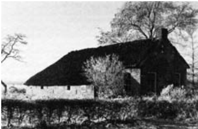
Huis van Sterke Hearke tussen Harkema en Drogeham, 1962 (inmiddels afgebroken)