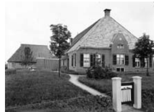
Boerderij Mame Ozinga rond 1920

Spoken in de vorm van terugkerende doden (naloop) komen in volksverhalen veel voor.