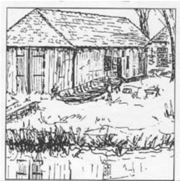
Scheepshelling, Waltsje 1. Tekening Frits Hollema, 1994