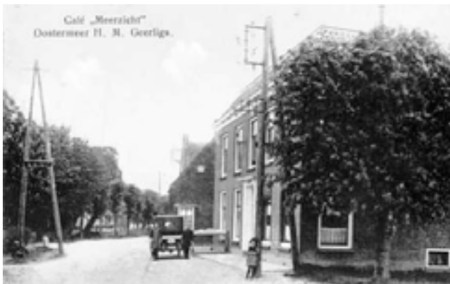
Café Meerzicht rond 1925